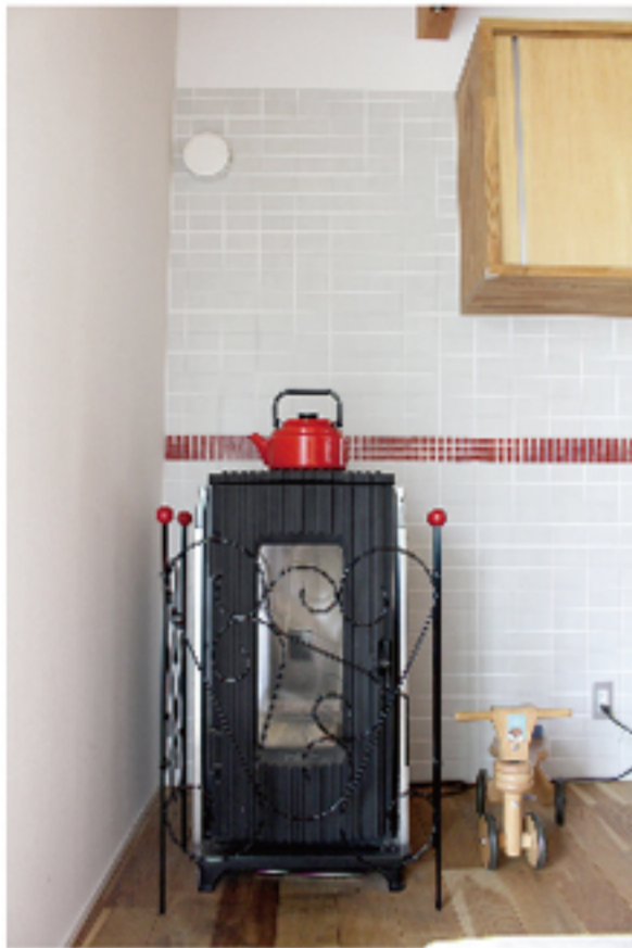
冬はこれ一台!!ペレットストーブ