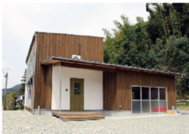
宇部市 見せる家 2016年3月完成