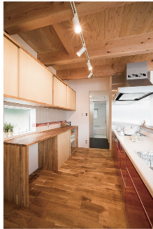
大好きな赤を取り入れたキッチン