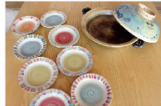
奥様の手料理とご自慢のお皿