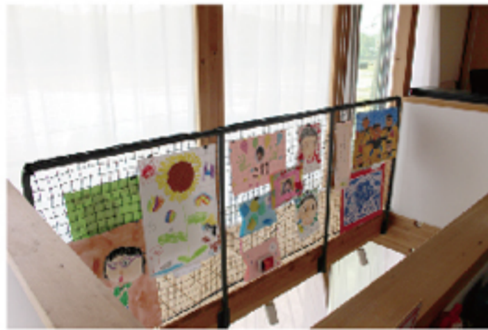
ダイニングから見える2階通路の手摺ネットには 子供たちの作品が飾られギャラリースペースとして活用