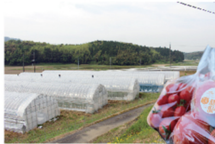
「食べることを楽しく!」を モットーに、 日々の食卓が笑顔で溢れ、 食べることが楽しくなる野菜を作り届けているまっこ農園さん。