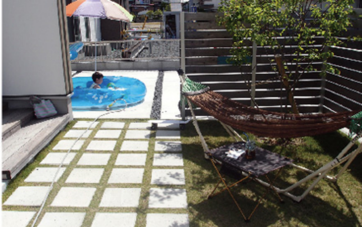
庭にテーブルやハンモックをだして、ちょっとしたアウトドア気分を・・・。